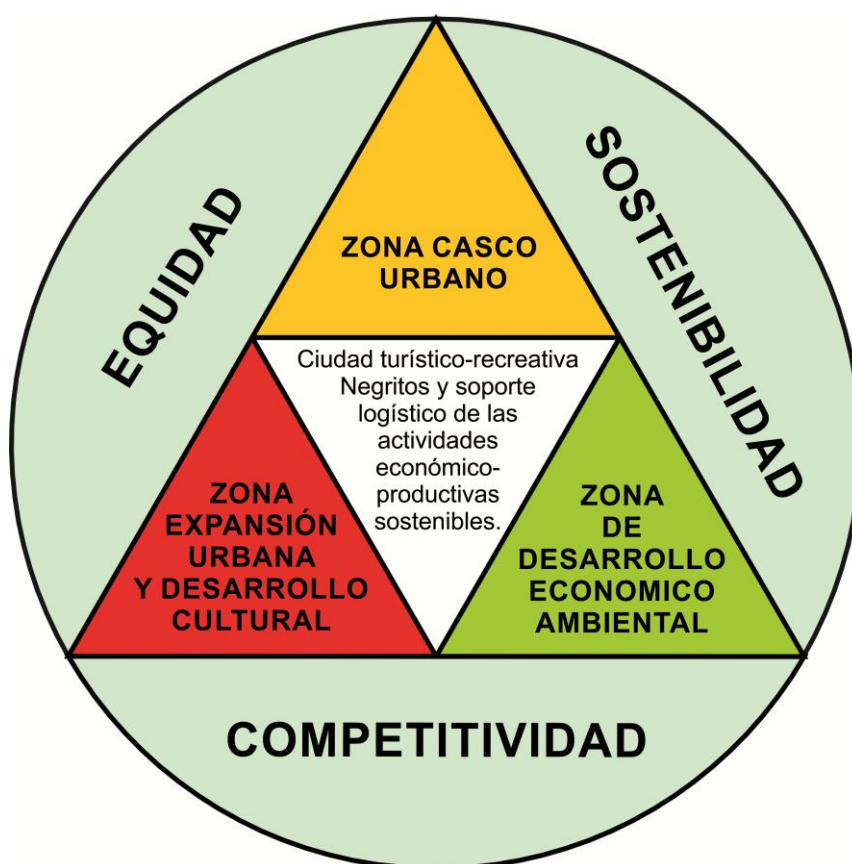
Lamina N° 04: Visión sistémica de Desarrollo Urbano Sostenible de la Ciudad de Negritos al 2024.